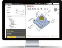
3D データ まとめて1分見積もり