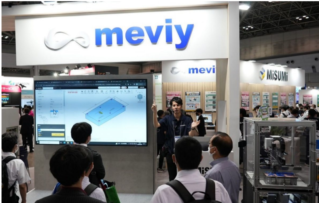
各地の展示会で大盛況だったライトセッションの様子

デジタルものづくりで設計を劇的に効率化できる meviy の仕組みと meviy が実現するデジタルマニュファクチャリングシステムを紹介します。