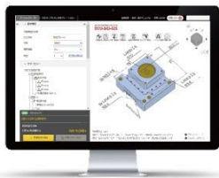
3D データ まとめて 1 分見積もり