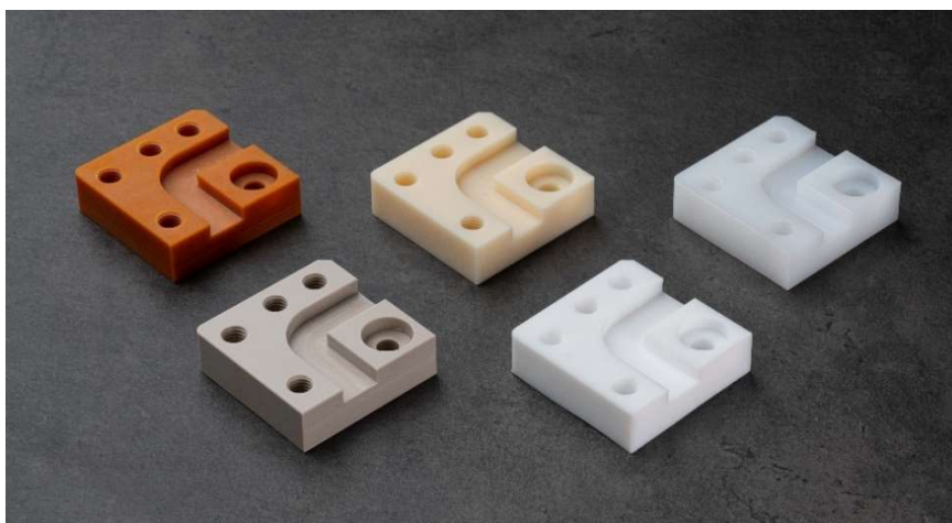
左上から時計回りに、紙ベークライト(自然色)、ABS(自然色)、超高分子量ポリエチレン(乳白色)、ふっ素・PTFE(白)、PEEK(灰褐色)

meviyは設計データをアップロードするだけでAIが価格と納期を即時回答、加工から出荷まで最短即日を実現する、製造業における部品調達の革新的なサービスです。国内の利用者数は40,000ユーザを突破、リピート率は8割を超え、オンデマンド製造サービスにおいて国内シェアNo.1を獲得しています。