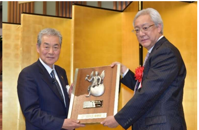
経団連会館にて執り行われた贈賞式

十大新製品賞は、ものづくりの発展や日本の国際競争力強化に役立つ製品を日刊工業新聞社が表彰する、1958年(昭和33年)より続く歴史ある賞です。第62回目となる今回も、産業・社会の発展に先導的役割を果たす世界最高水準の性能と評価された製品10件を本賞として表彰、贈賞式が1月23日に経団連会館で開かれました。