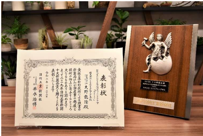
第62回(2019年)十大新製品賞 賞状と楯