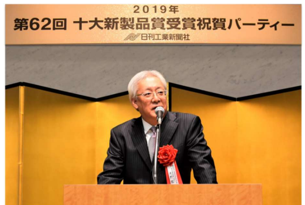
祝賀パーティーで挨拶する 大野代表取締役社長 CEO

3DCAD データから製造工程を自動で生成し、加工・検査を含めた精緻な原価計算アルゴリズムによって5秒で見積もりを算出します。加えて、独自のデジタルマニュファクチャリングシステムにより最短1日で出荷、これまで通常数週