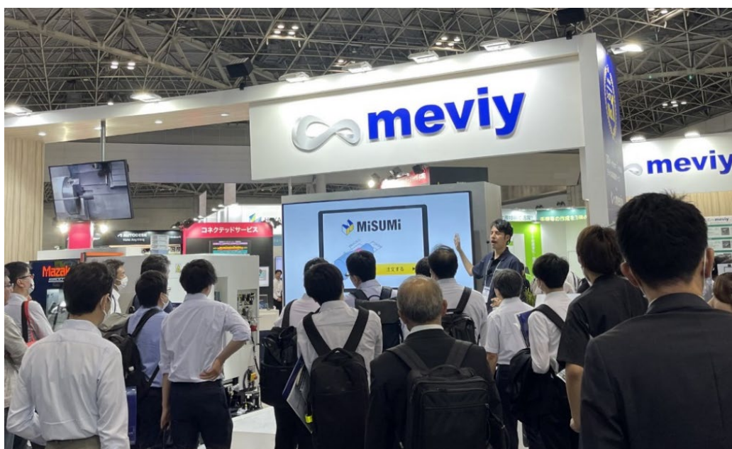
2023 年 6 月開催 「設計・製造ソリューション展(DMS)」(東京ビッグサイト)出展の様子

デジタルものづくりで設計を劇的に効率化できる meviy の仕組みを、工作機械を動かして実演。ヤマザキマザック株式会社との連携により、meviy で手配できる部品の見積もりから発注、加工までの流れを目の前でご覧いただけます。