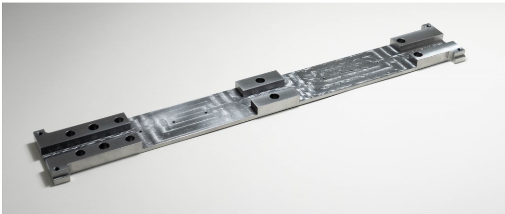
SS400 焼鈍材で製作した高精度重切削加工品の例

SS400 焼鈍材は、熱処理を施すことで削り加工による歪みを抑制出来る素材です。複雑な設計部品や高精度部品などへの対応領域を拡大、多くの部品を一括発注できる調達サービスの利便性を高めます。