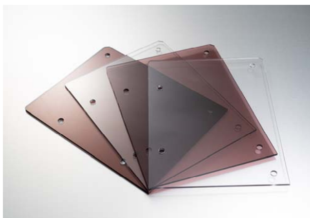
meivyでの製作例 2グレード・2色

透明樹脂プレートの特注は手間や時間が多くかかることから、meivyでの効率的な調達を切望する声が多く、この度取り扱いを開始します。複雑な形状のプレートも、3DCADの設計データをブラウザ上にアップロードするだけで即時見積、標準3日での調達が可能となります。meivyはこれからも市場のニーズを反映しデジタルものづくりプラットフォームを強化、製造業の非効率解消に确实短納期で貢献します。