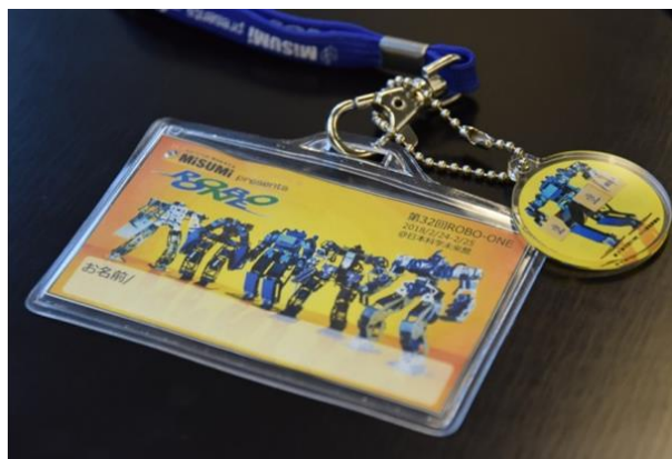
小学生以下のお子様全員にプレゼント予定の 特製カードストラップ