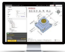
3D データ まとめて1分見積もり