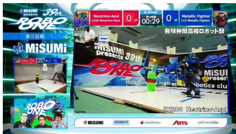
第39回 ROBO-ONE リモート大会画面

ものづくり技術の向上と二足歩行ロボットの普及を目的に、一般社団法人二足歩行ロボット協会が2002年より開催している二足歩行ロボット格闘競技大会。国内のみならず海外も含め、学生からプロのエンジニアまで、幅広い層がエントリーしています。