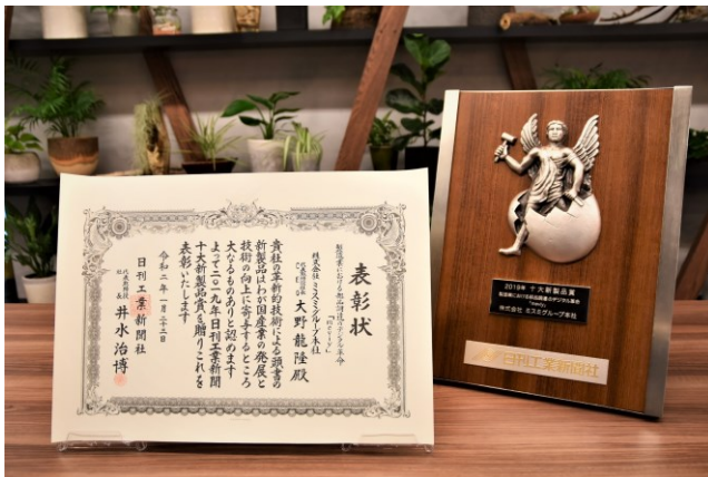
第62回(2019年)十大新製品賞 賞状と楯