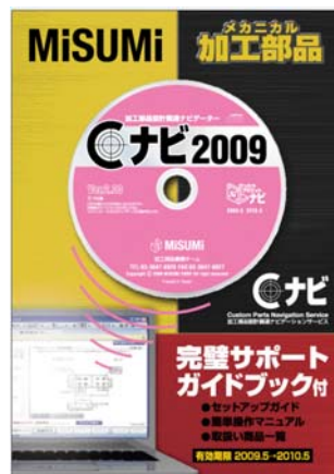
「メカニカル加工部品 C ナビ 2009+ガイドブック」国内版

サービス導入に当たっては、お客様のPC環境に合わせて選べる CD 版・WEB 版の2種類のサービスをご用意、お客様社内で行う無料「C ナビセミナー」も開催しております。